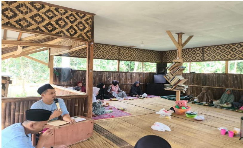
Gambar 2. Kegiatan Pengajian Ibu-ibu Majelis Taklim Darunnufus

Penelitian kualitatif ini menggunakan tiga teknik utama dalam pengumpulan data. Pertama, wawancara mendalam ( in-depth interview ) secara semi-terstruktur kepada ibu-ibu jemaah untuk menggali pemahaman mereka secara utuh terkait penerapan konsep keluarga sakinah . Kedua, observasi partisipatif, yaitu peneliti terjun dan berbaur langsung dalam kegiatan pengajian untuk mengamati interaksi sosial, metode penyampaian materi dakwah, dan dinamika kelompok jemaah. Ketiga, teknik dokumentasi yang bertujuan untuk mengumpulkan bukti autentik dan merekam berbagai aktivitas yang berlangsung di majelis taklim tersebut.