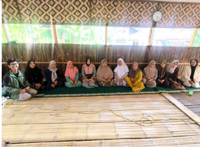
Gambar 4. Foto Bersama Ibu-ibu Pengajian Majelis Taklim Darunnufus