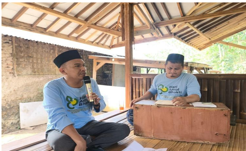
Gambar 3. Kegiatan Pengajian Ibu-ibu Majelis Taklim Darunnufus