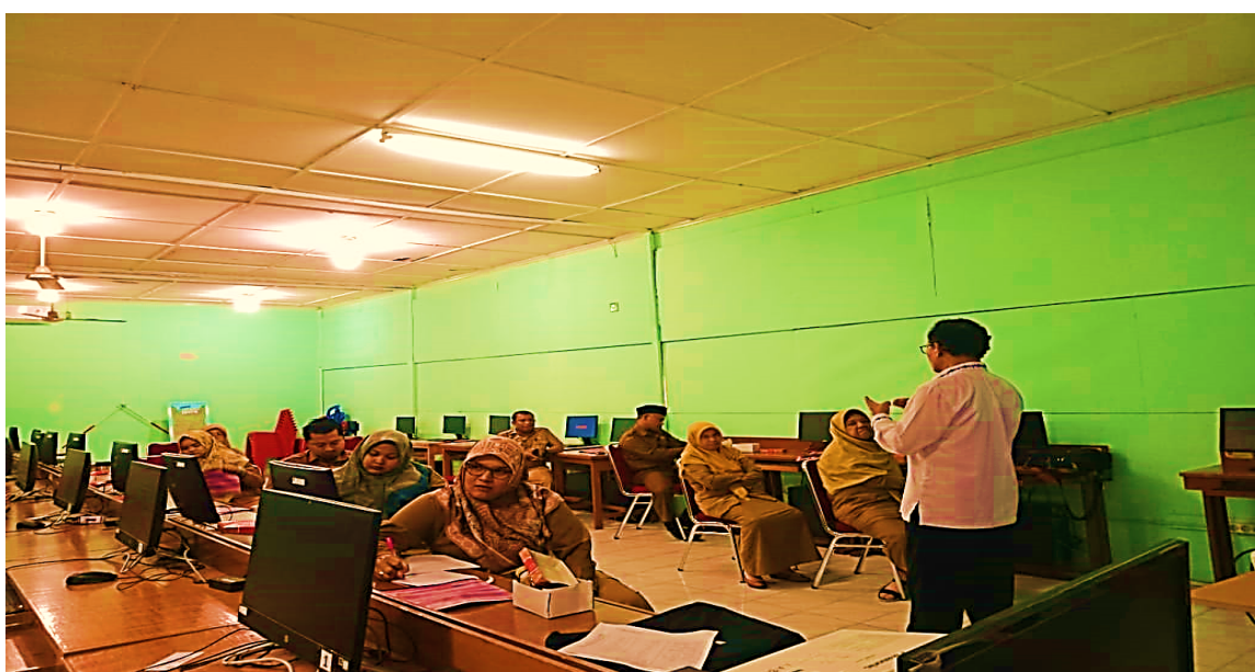
Gambar 2. Ice Breaking dan Pemantapan Konsep

Untuk menciptakan suasana pembelajaran yang lebih interaktif dan kondusif, kegiatan dilanjutkan dengan ice breaking melalui permainan “Gerakan 1, 2, 3 Eeeaaaa”. Aktivitas tersebut bertujuan membangun keakraban, meningkatkan partisipasi peserta, serta menciptakan suasana belajar yang nyaman. Selain itu, tautan daftar hadir berbasis Google Form juga dibagikan kepada seluruh peserta sebagai bagian dari administrasi kegiatan. Penerapan ice breaking dalam pelatihan ini sejalan dengan pendekatan andragogi yang menempatkan peserta dewasa sebagai subjek aktif dalam proses pembelajaran, sehingga guru-guru Bahasa Inggris tingkat SMA/ sederajat di Kota Padang dapat mengikuti kegiatan secara lebih antusias dan partisipatif.