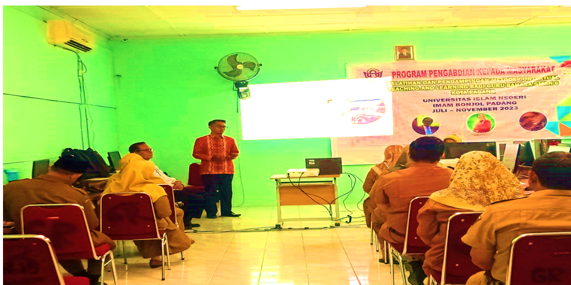
Gambar 3. Pemahaman Konsep dan Diskusi Keilmuan

Selain itu, narasumber juga menjelaskan manfaat serta strategi pengintegrasian kearifan lokal dalam pembelajaran Bahasa Inggris di tingkat SMA. Peserta diperlihatkan contoh latihan berbasis budaya lokal, seperti penggunaan teks tentang Lamang Tapai sebagai bahan pembelajaran. Penyampaian materi tersebut memberikan wawasan dan kerangka konseptual baru bagi peserta dalam mengembangkan pembelajaran yang lebih kontekstual dan relevan dengan lingkungan siswa. Respons positif terlihat dari beberapa peserta yang membagikan pengalaman mereka dalam menerapkan pembelajaran kontekstual berbasis kearifan lokal di kelas. Peserta lain menilai praktik tersebut sangat inspiratif karena mampu mengintegrasikan beberapa keterampilan berbahasa sekaligus, seperti membaca, menyimak, menulis, dan berbicara dalam satu kegiatan pembelajaran.