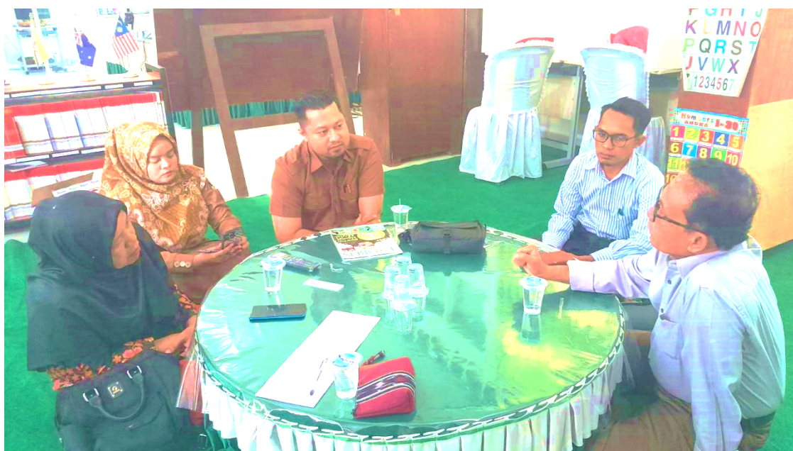
Gambar 4. Problem Solving dan Diskusi Pembelajaran

Pada akhir kegiatan, peserta diajak melakukan refleksi terhadap pengalaman belajar yang telah diperoleh, khususnya terkait implementasi kearifan lokal dalam pembelajaran Bahasa Inggris dan dampaknya terhadap peningkatan kualitas pembelajaran. Kegiatan refleksi bertujuan memperkuat pemahaman peserta sekaligus mendorong mereka untuk mengaplikasikan pengetahuan yang diperoleh ke dalam praktik mengajar di sekolah. Berdasarkan hasil refleksi, peserta menyatakan antusiasme untuk mencoba menerapkan pembelajaran berbasis kearifan lokal di kelas. Selain itu, banyak peserta juga menyampaikan minat untuk mengikuti pelatihan lanjutan yang lebih berfokus pada praktik penyusunan perangkat pembelajaran Bahasa Inggris yang terintegrasi dengan kearifan lokal