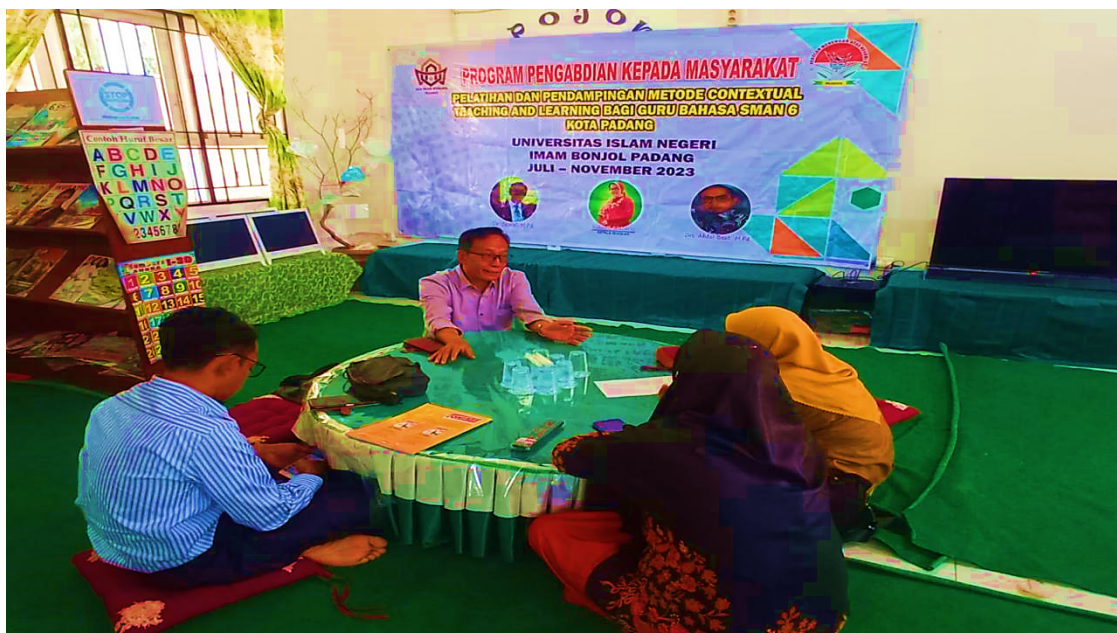
Gambar 5. Praktik dan Tinak Lanjut Pembelajaran CTL

mereka sebagai guru Bahasa Inggris. Selain itu, berdasarkan hasil refleksi kegiatan, seluruh peserta mengakui adanya peningkatan kompetensi dalam merancang pembelajaran Bahasa Inggris yang mengintegrasikan nilai-nilai kearifan lokal.