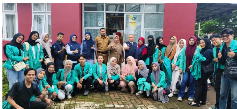
Gambar 2. Foto bersama Staff Kelurahan, Anggota Koperasi, Mahasiswa dan Dosen STIE Makassar Maju dalam kegiatan PkM

Pencapaian ini mendukung penelitian Andriani et al., (2025) yang menemukan bahwa pelatihan keuangan berbasis praktik mampu meningkatkan kedisiplinan keuangan individu, terutama pada kelompok masyarakat berpendapatan rendah. Pendampingan yang dilakukan