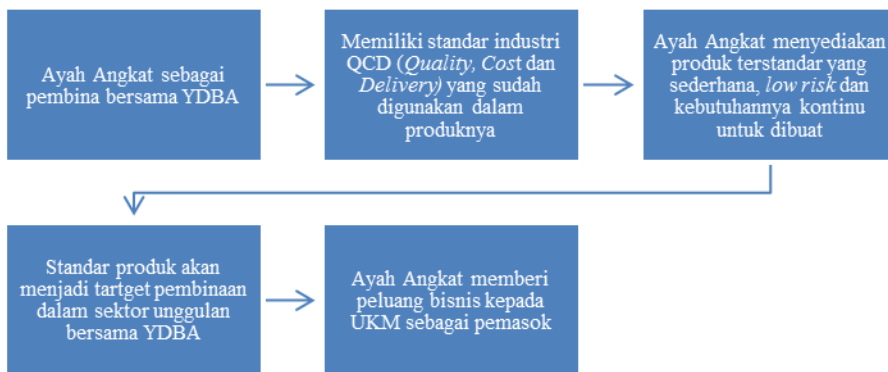
Gambar 1 Peranan Ayah Angkat dalam Sektor Unggulan YDBA

Pemberdayaan UKM yang dilaksanakan di Sentra Industri Logam Ngingas sejak 2015 merupakan bagian dari Program Sektor Unggulan sebagai pembaruan dari program sebelumnya. Pemberdayaan sektor unggulan bersifat lebih intensif yang ditujukan bagi kumpulan UKM sejenis pada lokasi yang sama dan sejalan dengan kompetensi bisnis Astra. Salah satu ciri khas dari pemberdayaan sektor unggulan adalah keberadaan Ayah Angkat bagi UKM. Ayah Angkat adalah pihak yang akan membantu UKM dari segi pemasaran maupun kompetensi. Ayah Angkat diutamakan perusahaan yang membutuhkan alternatif pemasok untuk menunjang bisnisnya. Ayah Angkat akan menentukan standar QCDI ( Quality, Cost, Delivery, Innovation ) dari UKM. Ketika Sentra Industri Logam Ngingas resmi menjadi sektor unggulan, YDBA meminta pihak Astra Honda Motor (AHM) untuk bekerjasama menjadi Ayah Angkat bagi UKM. Kemudian pada tahun 2015, AHM memperkenalkan PT. Rachmat Perdana Adhimetal (PT.RPA) yang merupakan pemasok tier 1 AHM sebagai pihak yang turun langsung menjalankan peran tersebut. Peranan Ayah Angkat secara lebih jelas ada pada Gambar 1 ini: